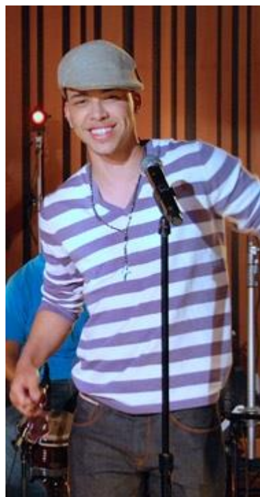
Prince Royce en una representación en Acceso Total en 2011.

que no se vendía música de bachata en ninguna tienda del país que fuera frecuentada por la llamada « alta sociedad » o sociedad culta de la isla, ni tampoco en discotecas, ni tan siquiera las emisoras de radio la programaban. Sin embargo, la excepción a esta situación de marginalidad la constituyó « Radio Guarachita » que fue la única emisora que se atrevió a transmitir bachata durante las primeras décadas de este ritmo y muy a contra marea de las estrictas prohibiciones que se promulgaron en su contra. Radio Guarachita fomentó y difundió esta música para consumo de aquellos grupos sociales marginales, emigrantes del campo a la ciudad, que con la caída de la dictadura de Rafael Leónidas Trujillo nutrió la población suburbana en las ciudades dominicanas.