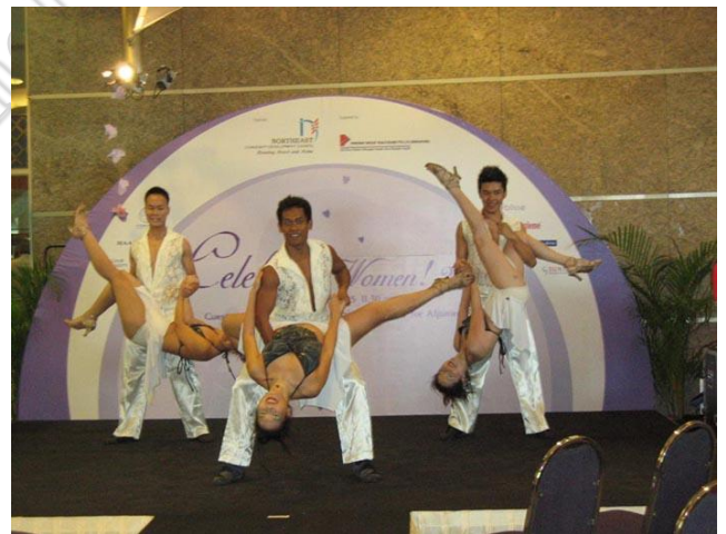
Bailarines de Salsa, por Chinfee. Fuente: wikipedia.org .

con compañeros de baile de otras escuelas. Sin embargo, sí que se diferencia algo la dirección con el estilo Nueva York de la dirección del estilo cubano , puesto que este último no se baila teniendo una imaginaria línea de baile, sino en movimientos circulares alrededor del compañero. Estos estilos de salsa en línea comparten el paso básico y la vuelta básica del llamado Cross-body lead . Se podría hablar de variados y diferentes estilos de salsa en línea muy extendidos y bailados como, por ejemplo, el estilo puertorriqueño y el estilo colombiano pero las dos principales tendencias de baile en línea son el estilo Nueva York y el estilo Los Ángeles (también conocido como estilo LA ).